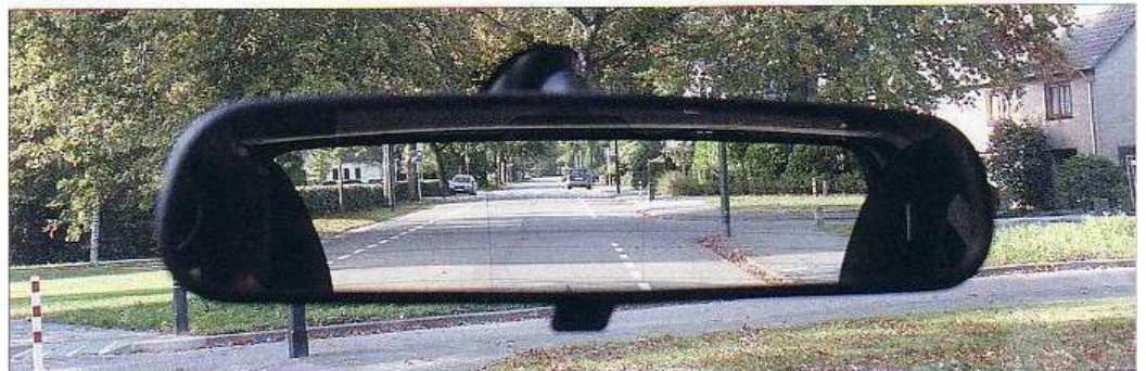
Goed afgestelde binnenspiegel.

Zorg ervoor dat je de bovenkant van de achteruit nog net in de binnenspiegel kan zien