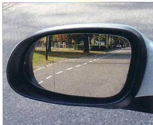
Goed afgestelde linkerbuitenspiegel.