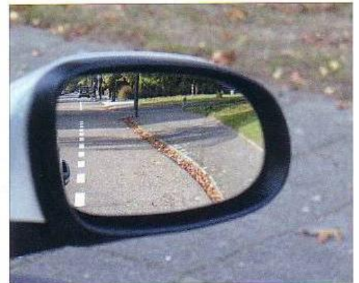
Goed afgestelde rechterbuitenspiegel.