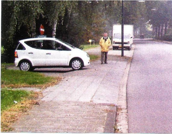
Uitritconstructie met doorlopend trottoir en rechte hoeken. Je moet alle verkeer, dus ook de voetganger voor laten gaan.